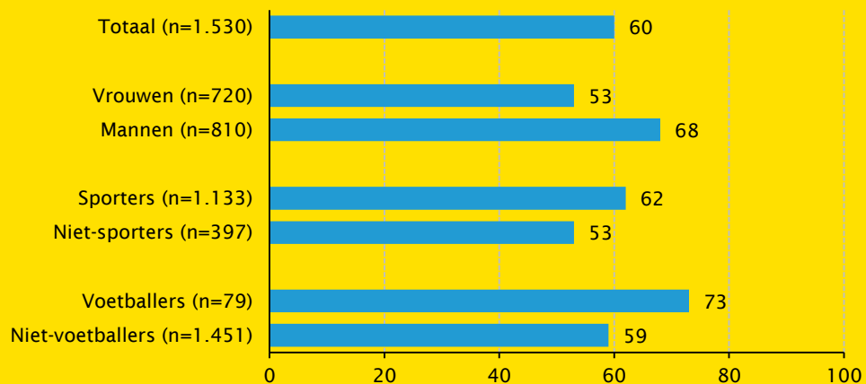
Figuur 1 Mate waarin EK vrouwenvoetbal 2017 is gevolgd (Nederlandse bevolking 16-80 jaar, in procenten)