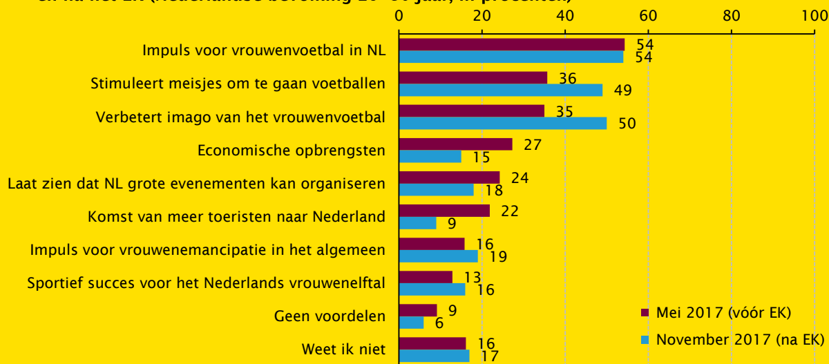
Figuur 2 Verwachte voordelen organisatie EK vrouwenvoetbal voor Nederland vóór en na het EK (Nederlandse bevolking 16–80 jaar, in procenten)